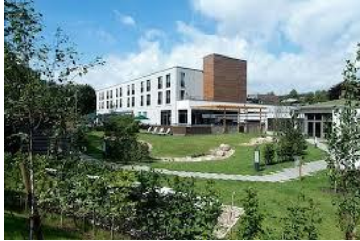
Hotel Aspria Uhlenhorst