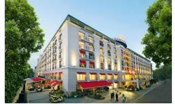
Hotel Grand Elysee